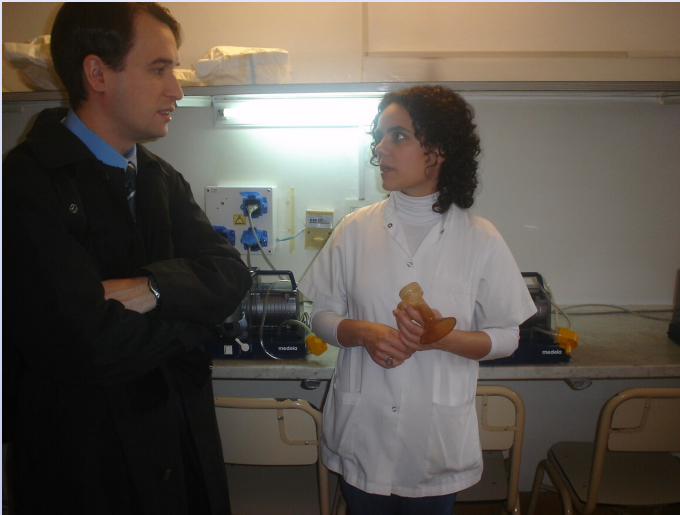
Visita al Centro de Leche Materna de la Maternidad Sardá, de la Ciudad Autónoma de Buenos Aires.

Los expertos visitaron además el Hospital San Martín , de la ciudad de La Plata, provincia de Buenos Aires, donde funciona el primer banco de leche materna del país, y la Maternidad Sardá donde pronto funcionará otro.